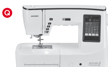
Q Computer Maschinen (9mm Stichbreite)

Weitere Informationen, finden Sie auf den Seiten 5 bis 6.