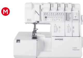
M Kombinierte Overlock-/ Covermaschinen