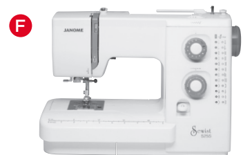
F Mechanische (Horizontal Greifer) Maschinen (5 mm Stichbreite)