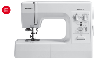
E Mechanische (Horizontal Greifer) Maschinen (6.5 mm Stichbreite)