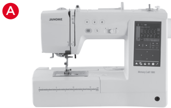
A Näh-& Stickmaschinen (7 mm Stichbreite)

Mit dieser Übersicht bestimmen Sie die Kompatibilität eines Zubehörs mit Ihrer Janome Nähmaschine.