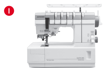
I CoverPro Maschinen