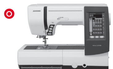
O Näh-& Stickmaschinen (9 mm Stichbreite)