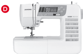
D Computer Maschinen (7 mm/5 mm Stichbreite)