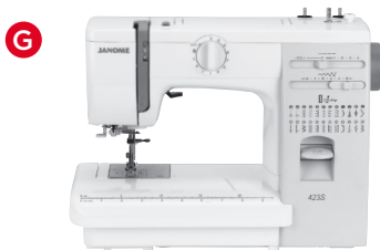
G Mechanische CB Greifermaschinen