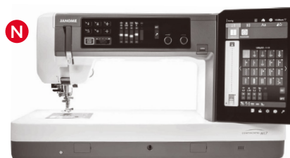
N Näh-& Stickmaschinen mit AcuFeed (9 mm Stichbreite)