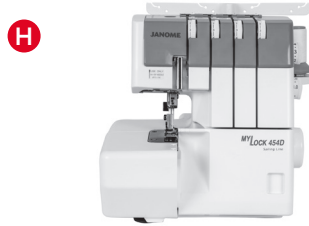
H Overlockmaschinen *ohne die Modelle 203,888