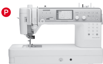
P Computer Maschinen mit AcuFeed (9 mm Stichbreite)