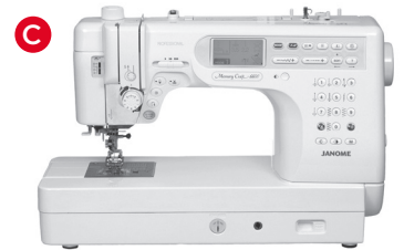
C Computer Maschinen mit AcuFeed System (7 mm Stichbreite)